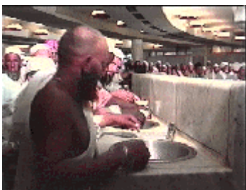
Des pèlerins au puits de Zamzam

Arrivée au sommet d'al-Marwa, elle entendit une voix. " Chut " se dit-elle. Elle tendit l'oreille, et entendit de nouveau. Elle dit alors : " tu t'es fait entendre, si tu as quelque secours. " Un ange apparut alors, à l'endroit où se trouve le puits de Zamzam. Il frappa le sol et l'eau sortit. Elle creusa un bassin, puis elle se mit à puiser de l'eau et à remplir son outre ; l'eau bouillonnait de nouveau chaque fois qu'elle en puisait. (...) Elle but et allaitea son enfant. L'Ange lui dit : " Ne redoutez aucun danger ; ici s'élèvera le Temple de Dieu, qui sera construit par cet enfant et son père ; Dieu n'abandonne pas les siens. "